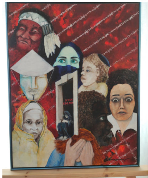
„Begegnungen“ (aus dem Meditationsweg)

Trotz der oft ernsten Inhalte versteht Umann seine Kunst jedoch nicht als reine Anklage, sondern als Appell an das Positive im Menschen. Am Ende bleibt nicht die Sorge, sondern ein leiser, aber spürbarer Optimismus - die Erinnerung daran, dass im Menschen die Fähigkeit zur Veränderung liegt! Vernunft, Mitgefühl und der Wunsch nach einem guten Miteinander: Diese leisen Kräfte ziehen sich wie ein roter Faden durch die Ausstellung.