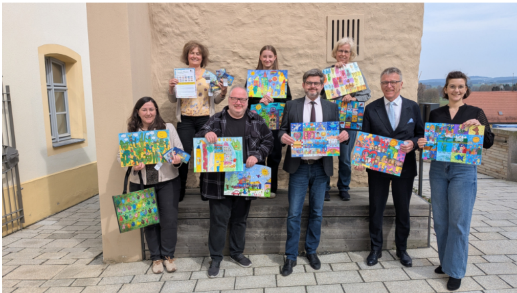
Die zehn ausgewählten Wettbewerbsbeiträge für die Rizzi-Ausstellung

Museumsbesucher dürfen sich ab 30. Mai mit Beginn der Ausstellung dann selbst ein Bild von den jungen Nachwuchskünstlern machen.