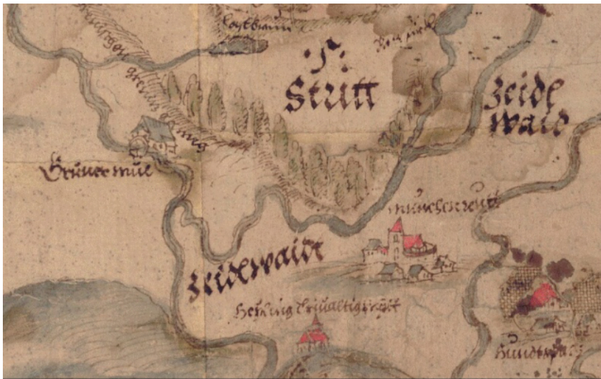
Zeidelweide bei Münchenreuth (Plan von ca. 1579)

Auch Flurnamen verweisen auf die Zeidelei, so „Zeidlwaidt“ in einem Plan von ca. 1579.