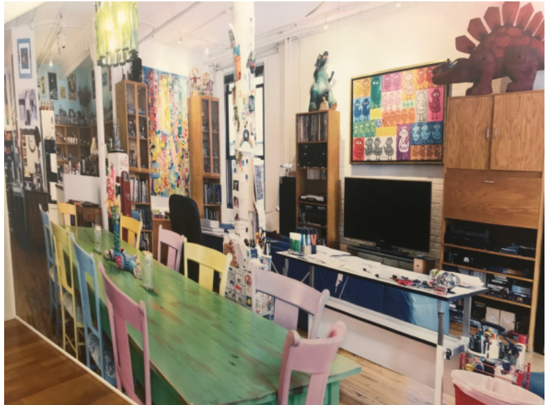
Atelier Rizzi New York

Mit der Kunstaussstellung möchte die Stadt Tirschenreuth auch die tschechischen Nachbarn ansprechen. Deshalb gibt es die Bildbeschreibungen und Führungen auch in tschechischer Sprache.