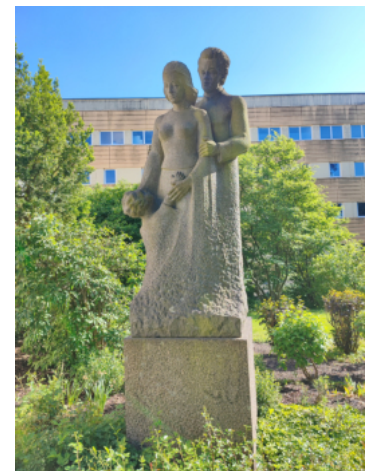
Eingang Krankenhaus Tirschenreuth