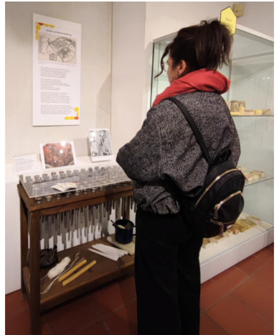
Ausstellungsstation "Kirche und Bienenhaltung" im Stiftlandmuseum

Für die Kerzenherstellung hatte man laut Johann Michael Füssel im Kreuzgarten eine Wachsbleiche: „Im Garten, den die vier Mauern einschließen [Kreuzgarten], und der blos zur Zierrath da zu seyn scheint, sahen wir eine Wachsbleiche. Sie geht von der unsrigen darinnen ab, daß das Wachs nicht in Täfelchen gegossen, sondern in die kleinsten Stücke zerschnitten, und auf grober Leinwand, durch die das Wasser abläuft, vor der Sonne ausgebreitet wird.“ Diese war notwendig, da Konzilsvorschriften weiße Kerzen für die Liturgie verlangten. Je nach Witterung dauerte der Vorgang, welcher nur in den Sommermonaten durchgeführt werden konnte, zwischen vier und sechs Wochen.