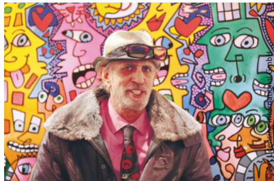
James Rizzi © Art Licensing International GmbH

Die umfangreiche Retrospektive führt durch die pulsierenden Straßen New Yorks. Mit Humor und unbändigem Optimismus zeigt Rizzi die Vielfalt seiner Heimatstadt, in der er den Großteil seines Lebens verbracht hat. Die Reihe „My New York City“ zeigt Rizzis verspielten Blick auf das Leben in der Großstadt und ist als Liebeserklärung an Big Apple zu verstehen.