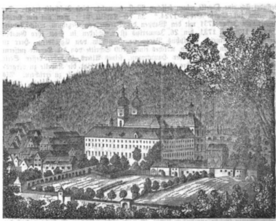
Orangerie nach dem Umbau zum Fabrikgebäude (Kalender für kath. Christen 1867)

In der Orangerie sammelte man – für die damalige Zeit – exotische Pflanzen wie Zitrusfrüchte oder Feigen. So entstand eine Art „grüne Bibliothek“, in der die Mönche, welche aufgrund ihres Gelübdes an den Klosterort gebunden waren, die für sie zunächst unbekannteren Pflanzen in der Praxis studieren konnten, anstatt sich nur mit Hilfe von Büchern in der Theorie über diese zu informieren.