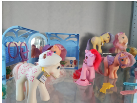
„My Little Pony“ von Hasbro

Was für viele lediglich Spielzeug ist, betrachtet die Sammlerin heute mit dem geschulten Blick einer Expertin. Regelmäßig besucht sie Sammlerbörsen in München oder Düsseldorf, ersteigert Konvolute und beschäftigt sich intensiv mit Materialien, Herstellungsverfahren und Restaurierungstechniken. Sie weiß genau, aus welchen Kunststoffen und Textilien die Figuren bestehen und wie sich diese reinigen oder wieder in den ursprünglichen Zustand versetzen lassen.