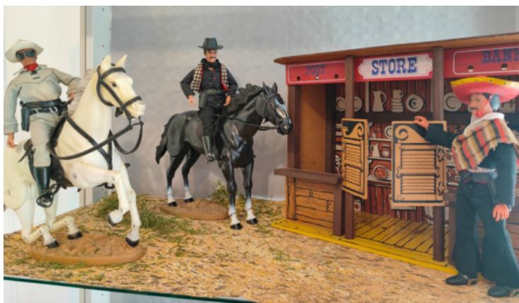
„Lone Ranger“ Serie - Vintage-Figuren aus den 1970er-Jahren

Die Besucher dürfen sich auf eine Zeitreise voller Erinnerungen freuen. Für die ältere Generation wird die Ausstellung zum Wiedersehen mit alten Freunden aus Kindertagen. Für jüngere Besucher eröffnet sich ein faszinierender Blick auf die Spielwelten ihrer Eltern und Großeltern. Und vielleicht wird mancher Erwachsene beim Anblick von Barbie, Big Jim oder He-Man für einen Moment wieder jenes Kind sein, das einst staunend vor einem Schaufenster stand und davon träumte, welche Abenteuer hinter der nächsten Spielzeugverpackung warten.