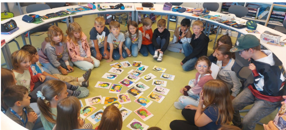
Schülerinnen und Schüler der Theobald-Schrems-Grundschule Mitterteich bei der Vorstellung der Kunstwerke