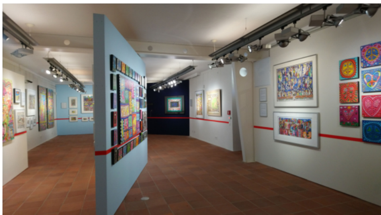
Hunderte Grafiken und Leinwände in jeder Größe und Couleur sind im MuseumsQuartier in Tirschenreuth zu sehen