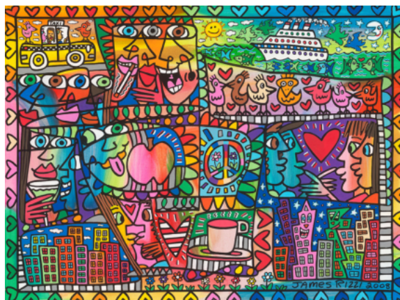
At Peace In My Big Apple